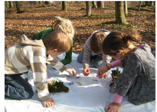
Gemeinsame Fortbildungen 2020 der Naturschutzzentren im Kreis Ravensburg